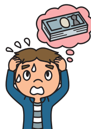
扶養者が事故や病気で 亡くなった