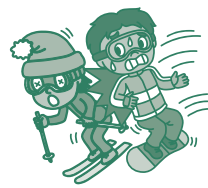
例/スノボ中に他人にケガをさせてしまった。

*2 携帯電話、スマートフォン、自転車、コンタクトレンズ、眼鏡等は、受託品に含みません。(詳細はP.6をご確認ください。)