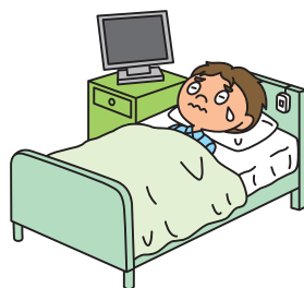
病気で2日以上入院