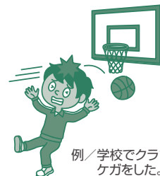
例/学校でクラブ中にケガをした。