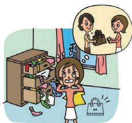
借りたバッグが盗難