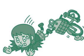
例/自転車で転倒してケガをした。

さらに、熱中症や細菌性食中毒およびウイルス性食中毒、法令で定める特定感染症を発病した場合も補償します。