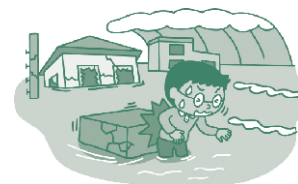
例/津波により流れてきた家具でケガをした。

掲載のお支払保険金金額例は当社が作成した事故例であり、過去に発生したものではありません。