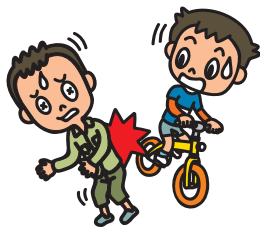
自転車で誤って 他人に衝突