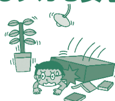
例/地震により転倒した家具でケガをした。