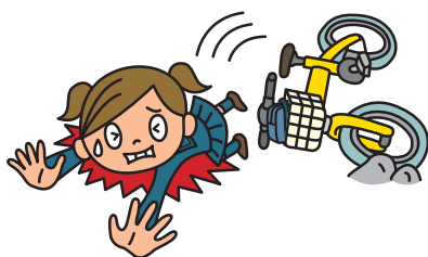
自転車で転倒してケガ